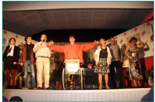
Après deux heures de spectacle, les rires et les applaudissements du public sont la meilleure des récompenses pour toute l'équipe de l'association.

La magie du théâtre est collective, dans les coulisses et sur scène, avec les spectateurs ; mais également individuelle : monter « sur les planches », c'est aussi se glisser dans la peau d'un autre pour mieux se connaître soi-même, c'est gagner en aisance orale, acquérir de la confiance en soi.